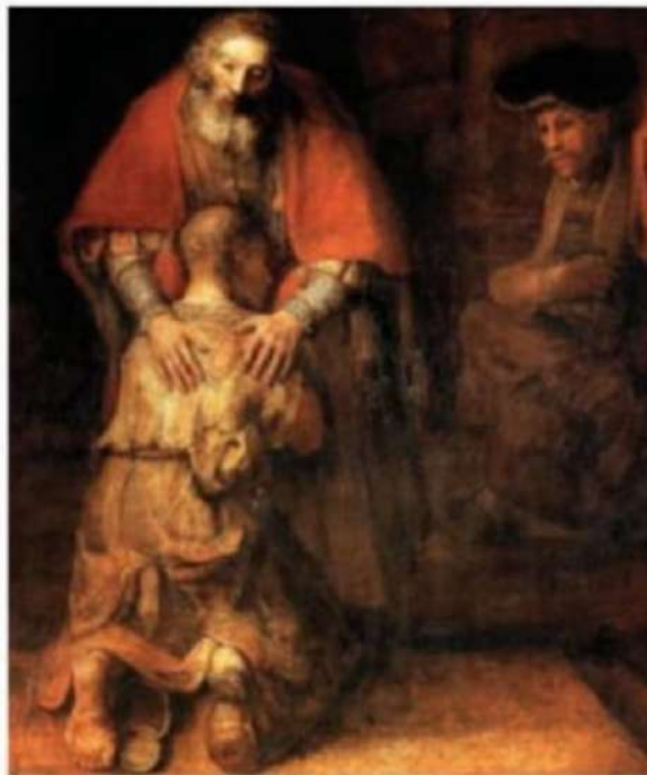
The Return of the Prodigal Son (Rembrandt, 1669)

Saudações colegas jornalistas e meus leitores no geral.