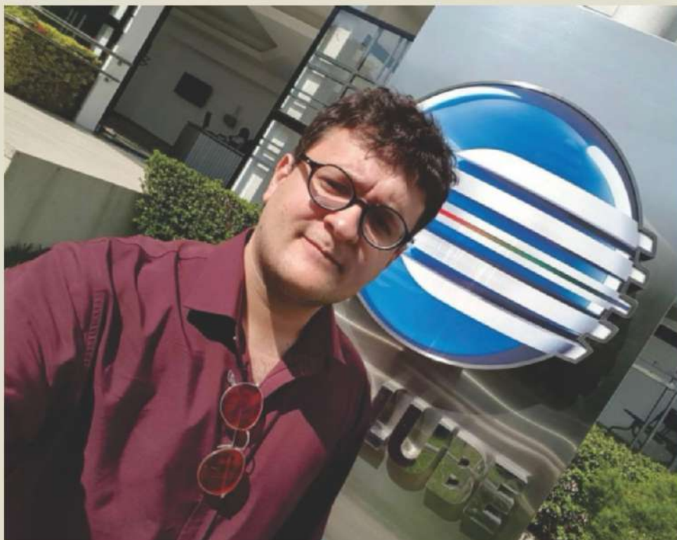
Petrus na Tv Clube / Rede Globo