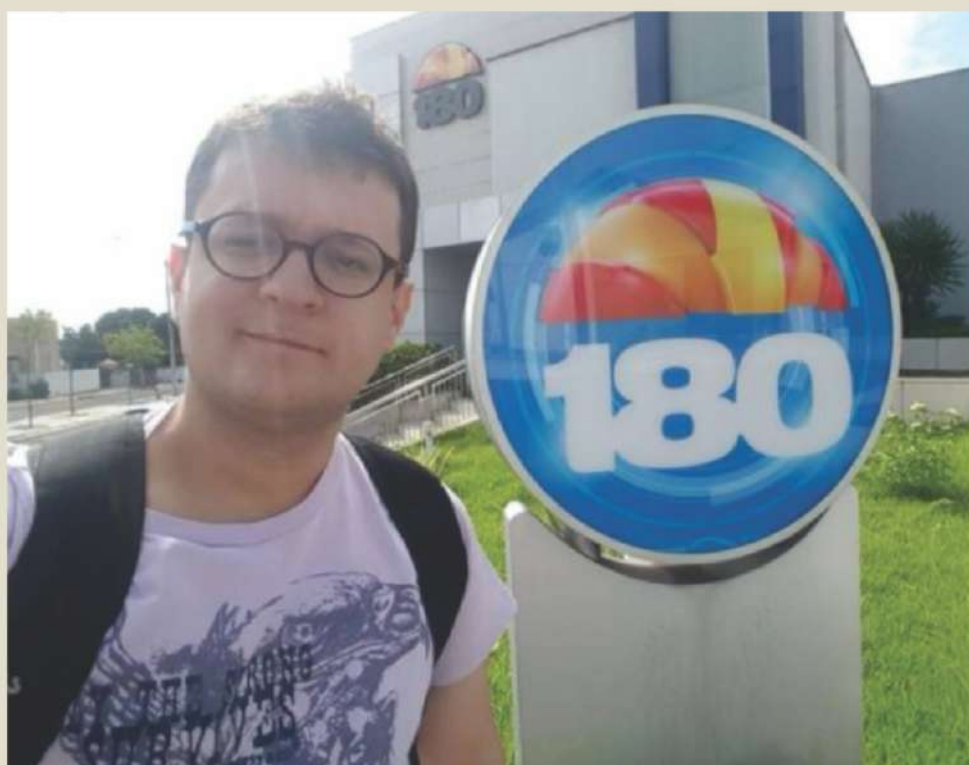
Petrus no 180 graus